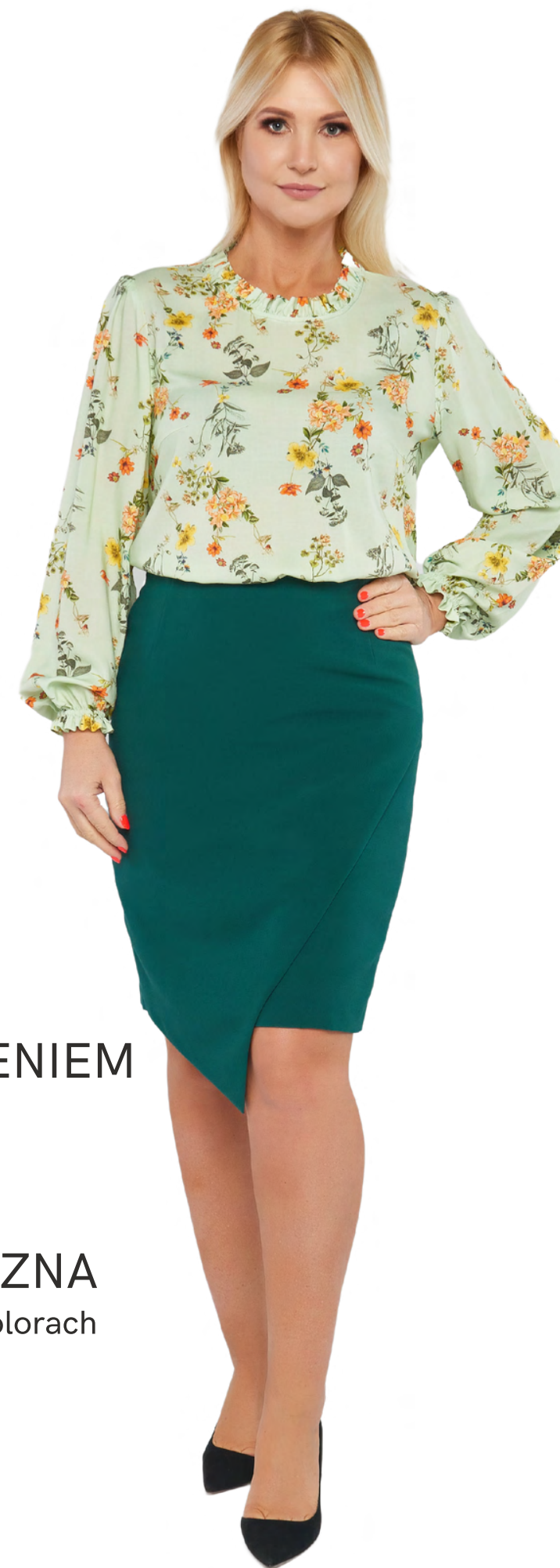
BLUZKA Z MARSZCZENIEM 239,-