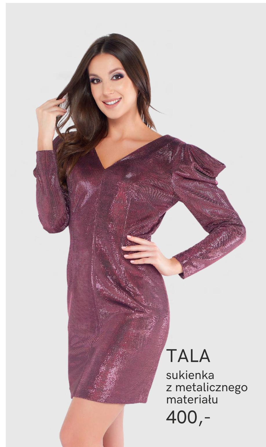
TALA sukienka z metalicznego materiału 400,-

W naszej ofercie znajdziesz ekskluzywne sukienki koktajlowe i wieczorowe w najmodniejszych kolorach i fasonach tego sezonu.