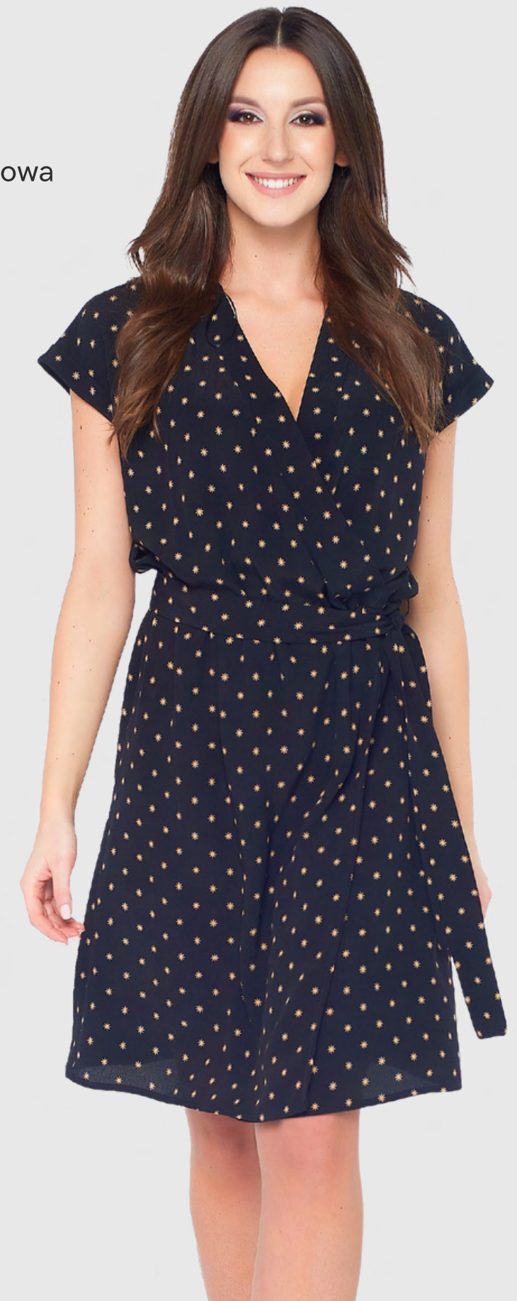
VERA sukienka kopertowa z paskiem 390,-