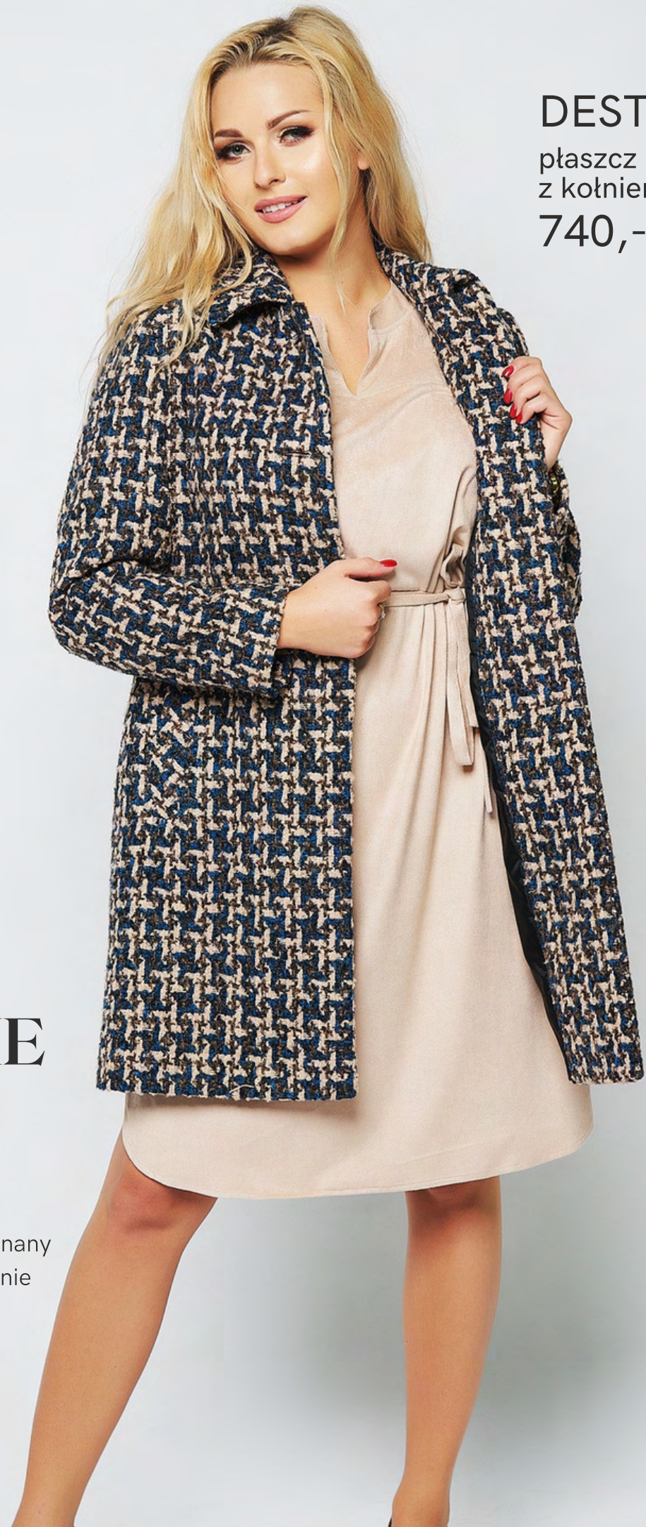
DESTA płaszcz z kołnierzem 740,-

Klasyczny i ponadczasowy płaszcz wykonany z tkaniny wełnianej - sprawdzi się idealnie na chłodne wczesnowiosenne dni.