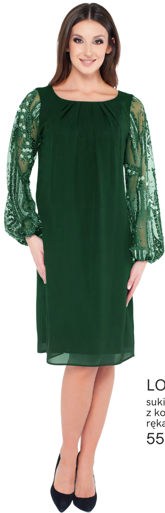
LORA sukienka z koronkowymi rękawami 550,-