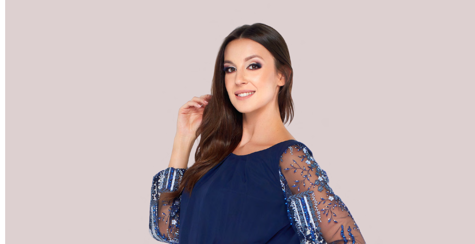
LORA sukienka z koronkowymi rękawami 550,-