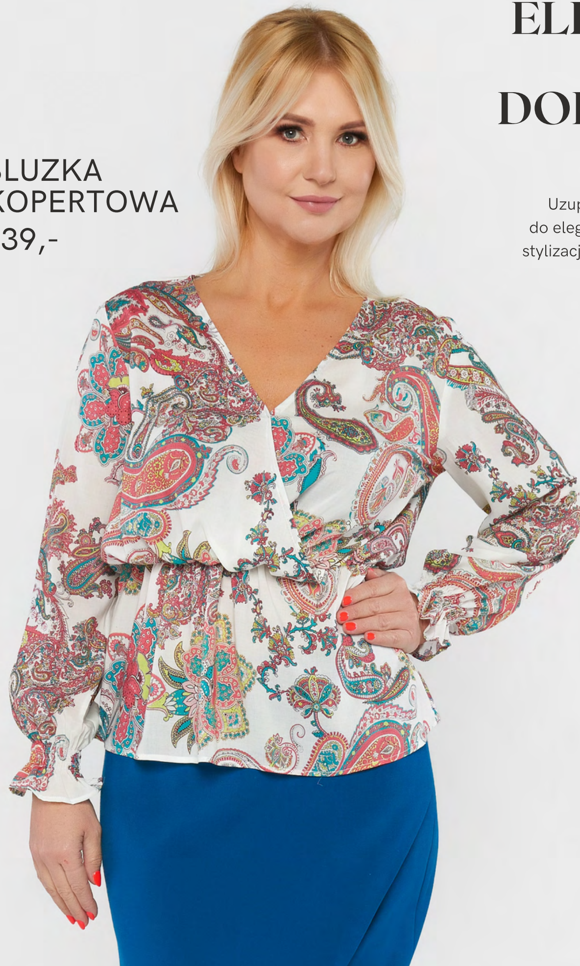
BLUZKA KOPERTOWA 239,-

Uzupełnij swoją garderobę bluzkami pasującymi zarówno do eleganckich spodni i spódnic, jak i do bardziej codziennych stylizacji. Z pewnością znajdziesz u nas fason pasujący na każdą sylwetkę.