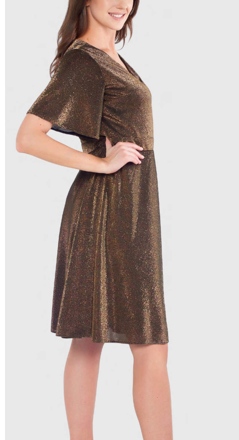
EMI koktajlowa sukienka za kolano 390,-