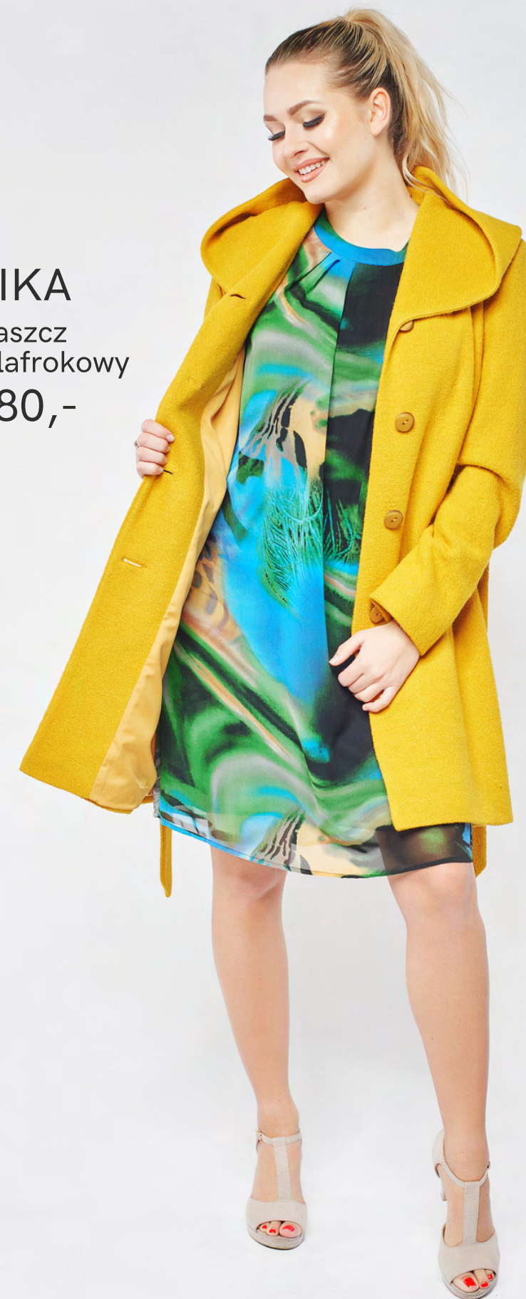
AIKA płaszcz szlafrokowy 780,-