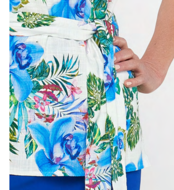
BLUZKA lniana w kwiaty 239,-