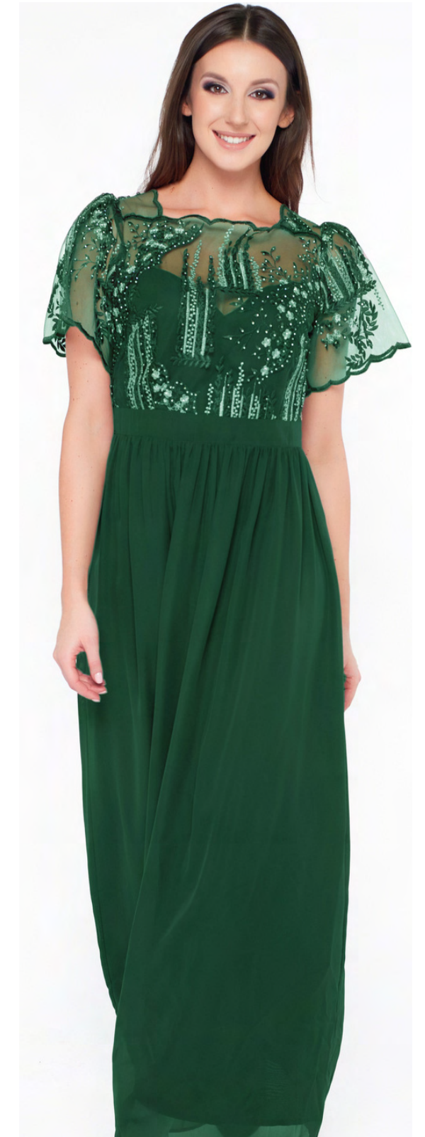
RENA maxi sukienka z koronką 650,-