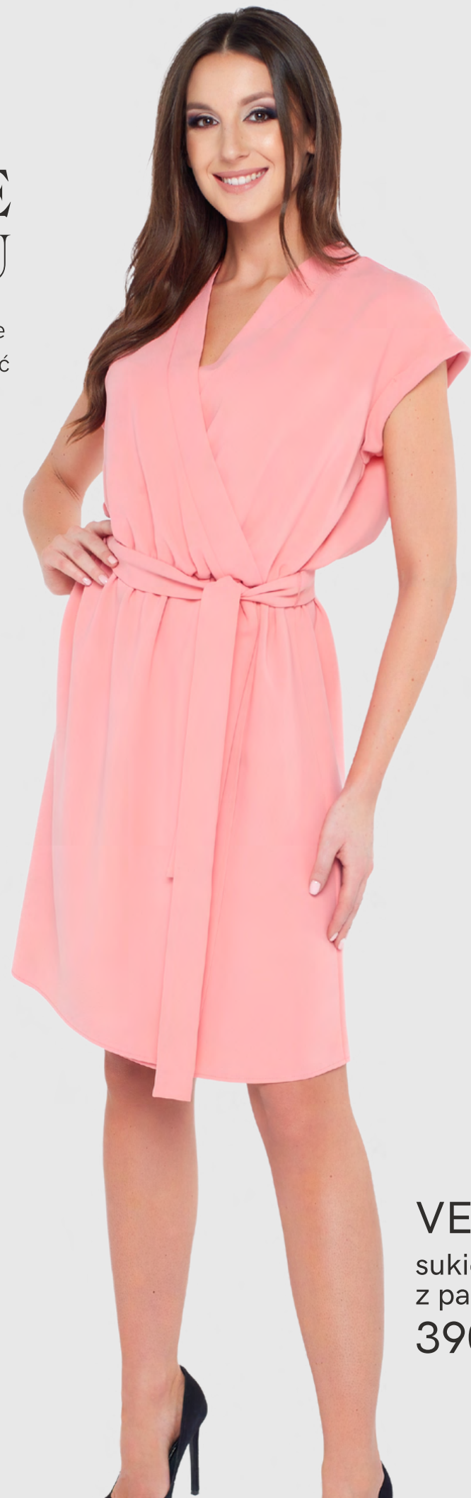
VERA sukienka kopertowa z paskiem 390,-

Lato, słońce, wakacje, piękna pogoda. Kto nie ma takich skojarzeń z latem? A co jeśli dołożyć do tego piękną, lekką, idealnie dopasowaną sukienkę w żywym kolorze?