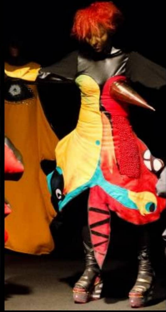
ANEKS Z MALARSTWA "ANATOMIA RAJSKIEGO PTAKA, OLEJ NA PŁÓTNIE, 5x 50x200