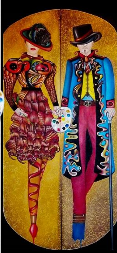
180x40 x 2