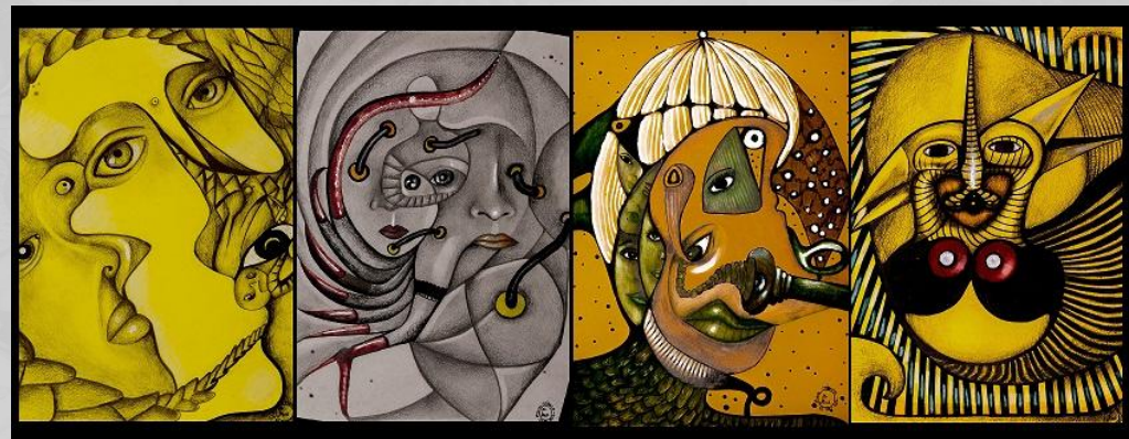
MALOWANE RYSUNKI, TECHNIKA MIESZANA NA PAPIERZE, 2013-2019