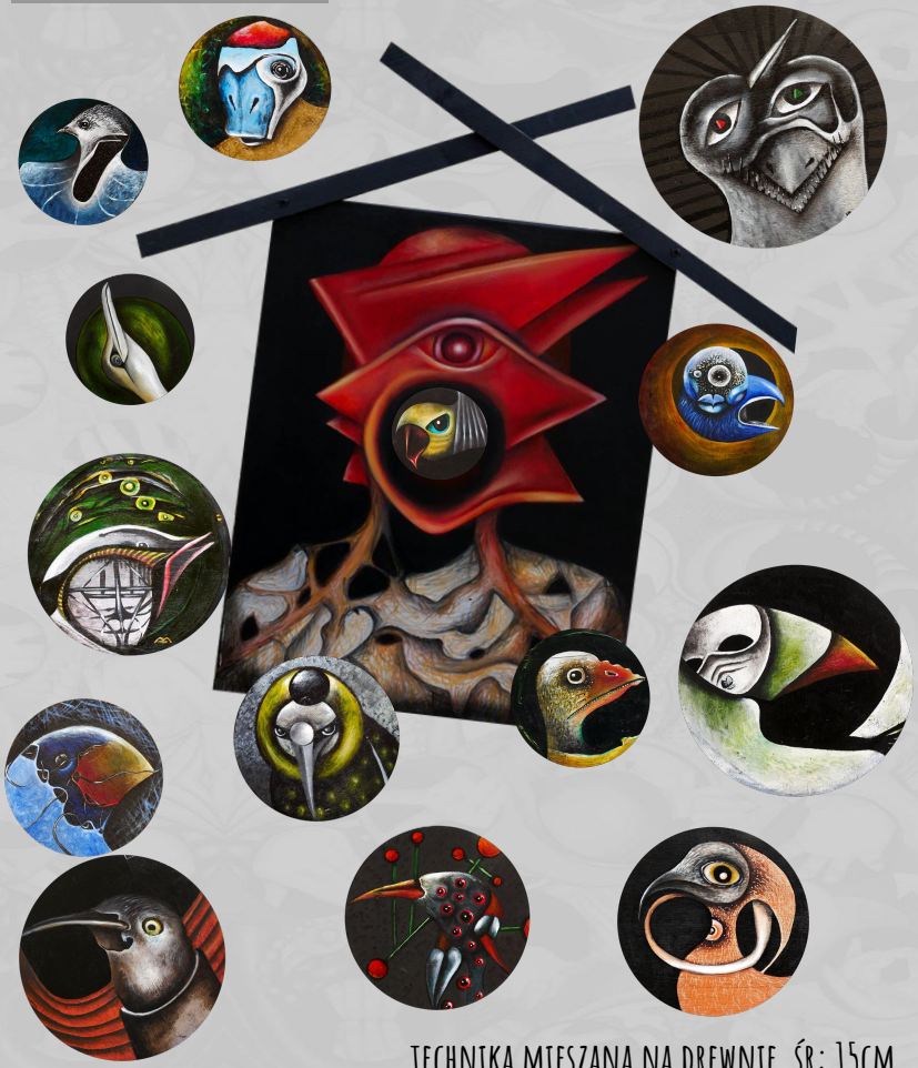
TECHNIKA MIESZANA NA DREWNIĘ, ŚR: 15CM

LINK DO FILMU NA YOUTUBE: https://youtu.be/38PL3WLWDXK