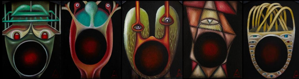
OLEJ NA PŁÓTNIE