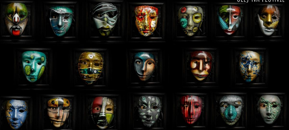
MASKI, TECHNIKA MIESZANA, 2018

LINK DO FILMU NA YOUTUBE: https://youtu.be/d57tS7IGH5U